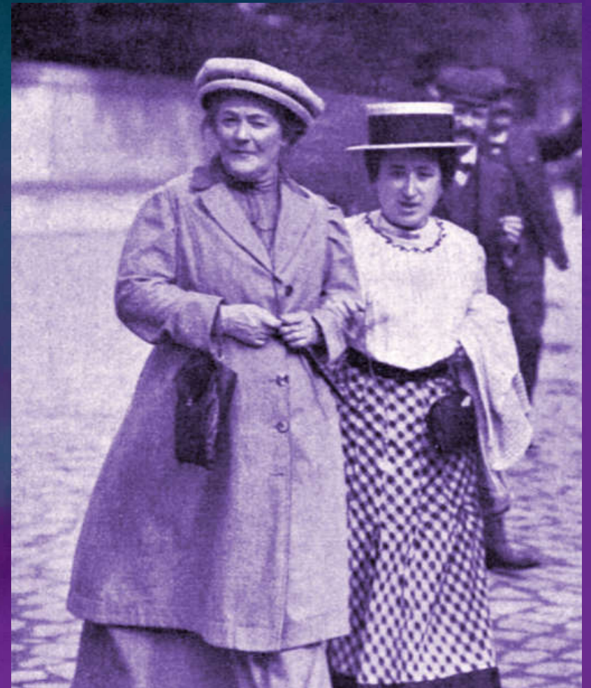
Clara Zetkin und Rosa Luxemburg waren revolutionäre Kommunistinnen, die der KPD angehörten und für die Befreiung der Frau kämpften.