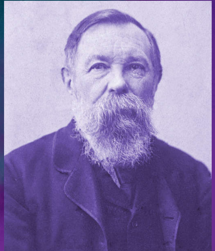
Friedrich Engels verfasste gemeinsam mit Karl Marx das kommunistische Manifest, in dem große Teile der marxistischen Weltanschauung festgehalten wurden.

Eine solche Blockbildung gegenüber dem erstarken China oder Russland stellt dabei eine Neuaufteilung der Welt dar. Mit zunehmender Konkurrenz der imperialistischen Mächte steigt auch die Gefahr eines Weltkrieges zwischen Atommächten. Der imperialistischen Ausbeutung gilt es sich deswegen entschieden entgegenzustellen. Antikapitalismus bedeutet somit konsequente und gelebte internationale Solidarität auf dem Weg zum Sozialismus.