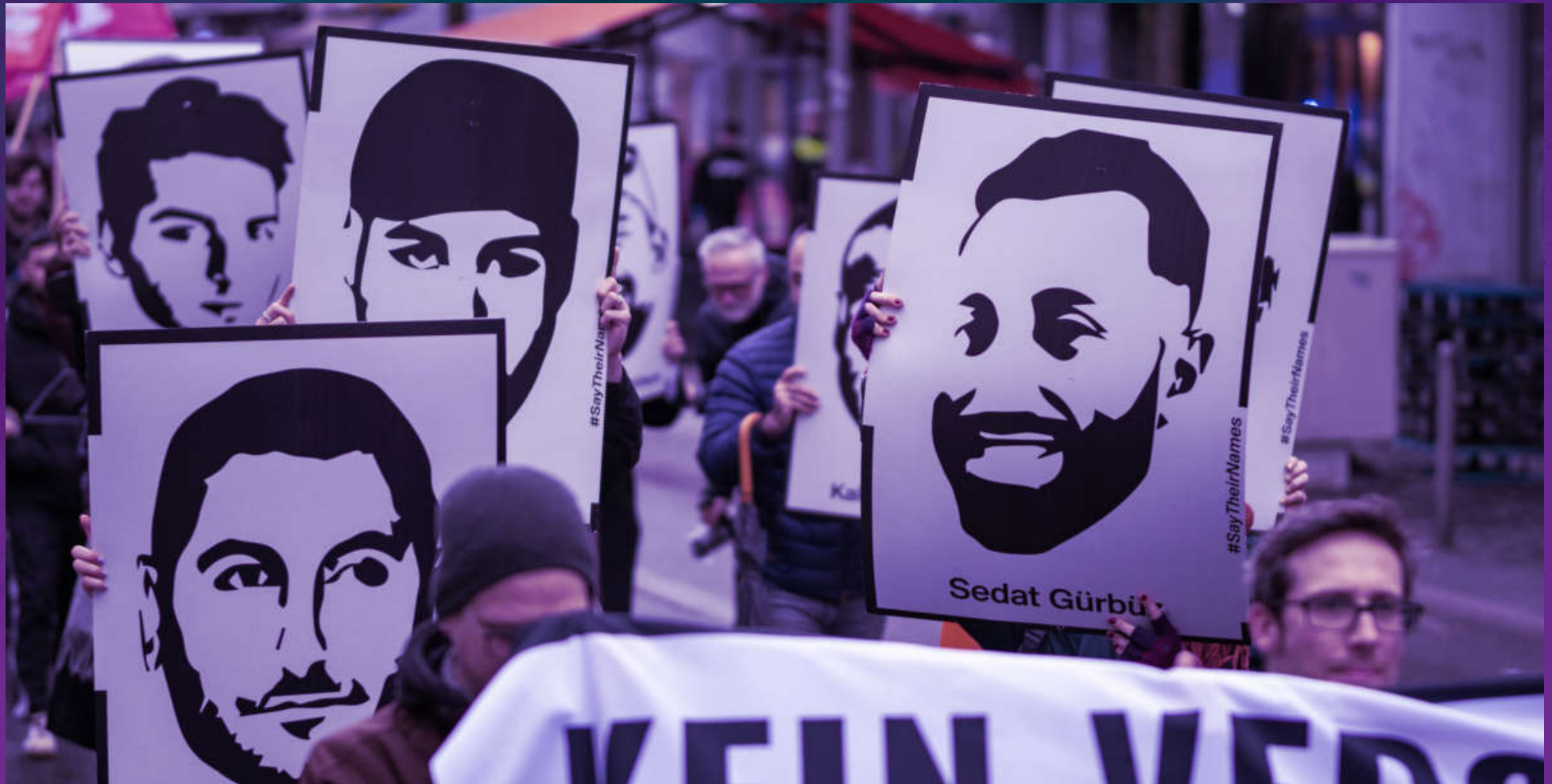
Gedenkdemo in Düsseldorf zum dritten Jahrestag des rassistischen Anschlags in Hanau.