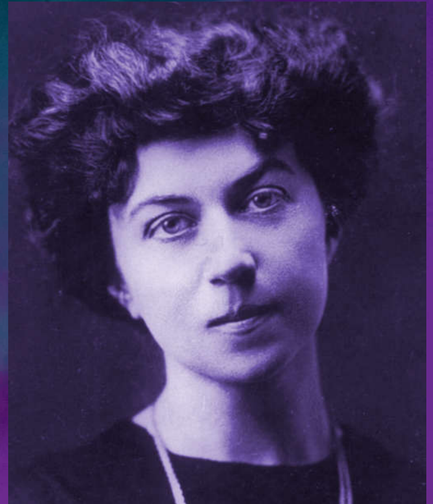
Alexandra Kollontai war eine feministische Marxistin und Revolutionärin. Sie wurde nach der Oktoberrevolution die erste Ministerin in der Geschichte.

Der Verkauf ihrer Arbeitskraft an Firmen und Konzerne wird trotz gleicher Ausbildung und Beschäftigung geringer bezahlt als der ihrer männlichen Kollegen. So werden sie strukturell von Männern abhän-