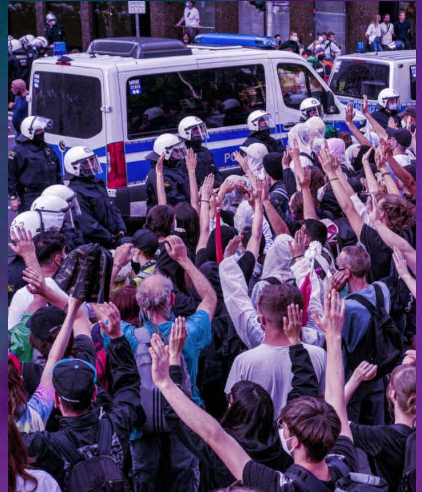
Demonstration in Düsseldorf gegen das neue Versammlungsgesetz.

Gleichzeitig entziehen sich im Kapitalismus alle wichtigen wirtschaftlichen Entscheidungen über die Produktion, die das Leben von Milliarden Menschen betreffen, jeglicher demokratischen Kontrolle. Wir haben stattdessen die „Wahl“, alle vier Jahre zu entscheiden, welche Mitglieder der herrschenden Klasse uns ver- und zertreten sollen. Solange jedoch die-