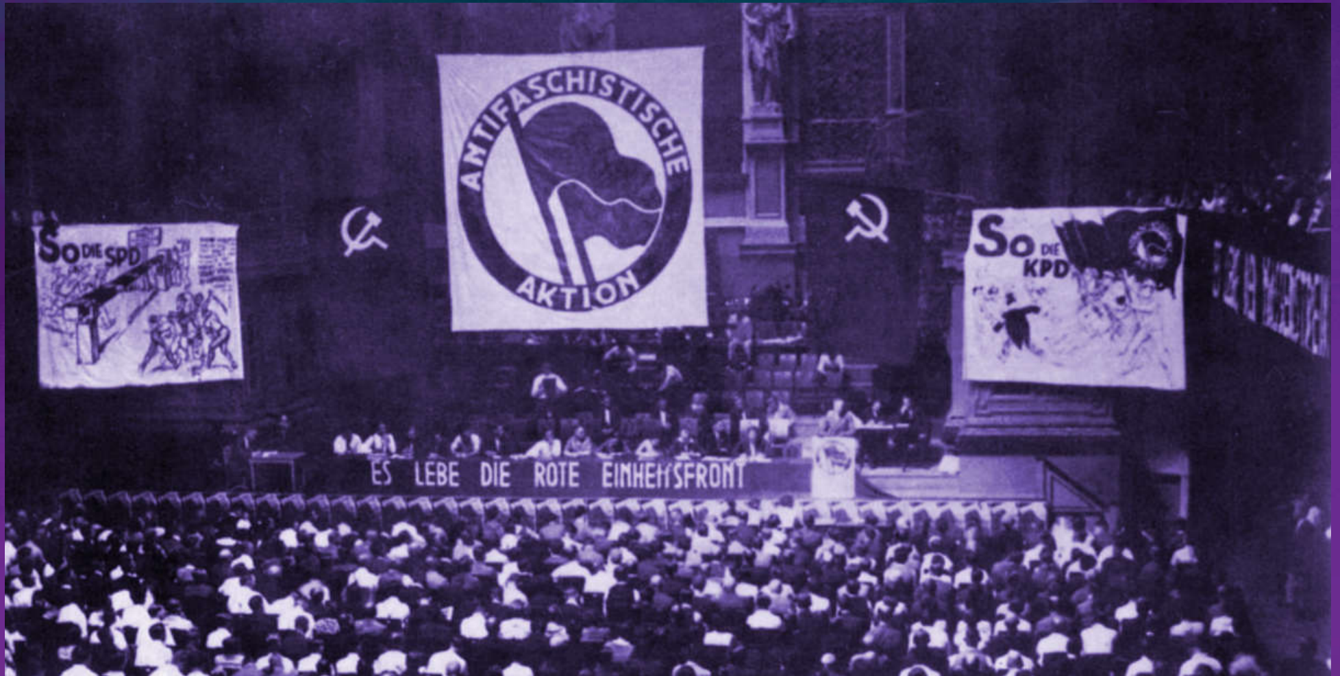
Infolge der zunehmenden Faschisierung rief die KPD im Jahr 1932 zur „Antifaschistischen Aktion“ auf.