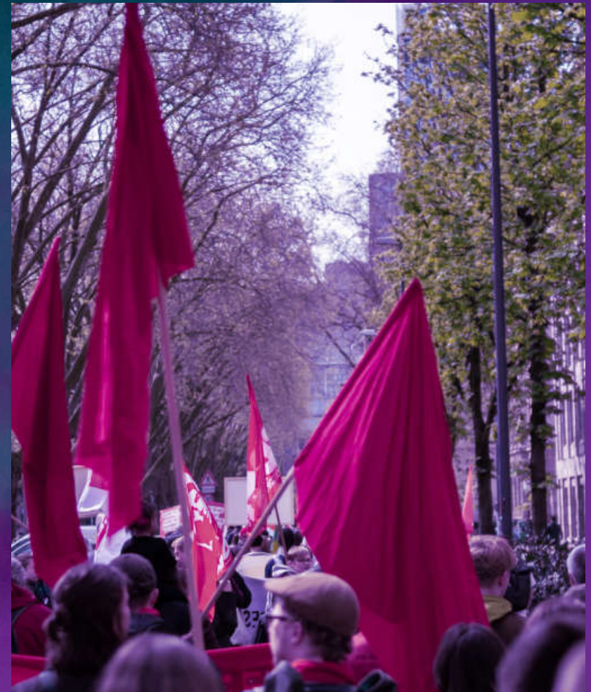
Demo zum 1. Mai, dem internationalen Kampftag der Arbeiter:innenklasse.